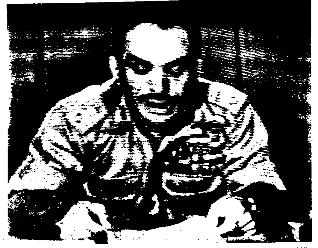
الملك «سبراميس» هذه الصورة لجلالة الحسين عندما كان جالسا مع كلبه السابية عبر التلفزيون الاردني

يا ابناء الامة العربية في كل مكان ، احتلها على الضفة الغربية من قبل اسرائيل بعدوانها السافر المعروف على الامة العربية ، وشدت عليها حربا اعتد ابرا منذ امد طويل . وعلى الرغم من انه لم يكن ينبغي لامة العربية ان تخليا بذلك العدوان ولا تلك الحرب ، الا ان اسرائيل استطاعت نتيجة لعوامل عديدة ، ان تكسب الجولة ، وفرضت عن طريق الغزو المسلح والقوة العسكرية ،